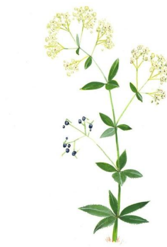
Aquarelle de Richard Mongenet