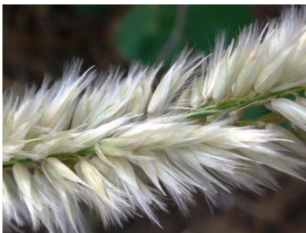
Pendant la floraison

Celui qui cueille une fleur dérange une étoile