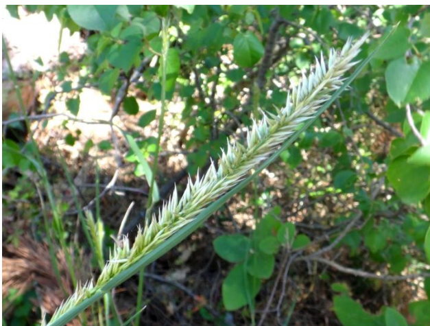
Avant la floraison