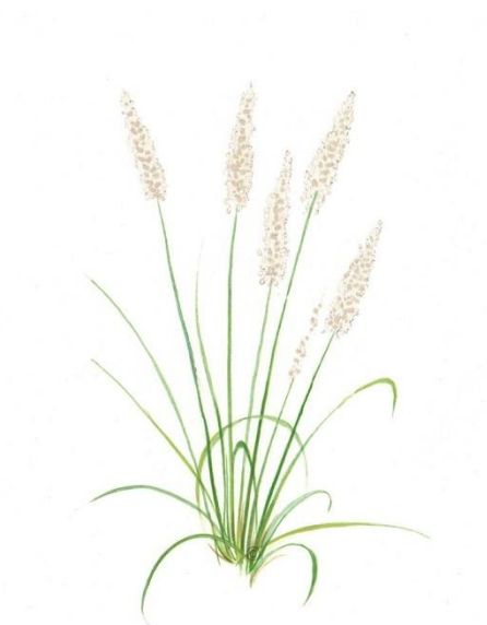
Aquarelle de Richard Mongenet