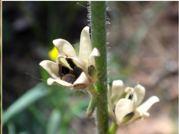
Fruit et graines

Celui qui cueille une fleur déränge une étoile