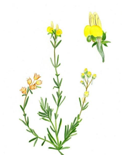
Aquarelle de Richard Mongenet