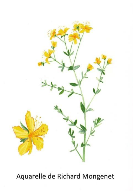
Aquarelle de Richard Mongenet