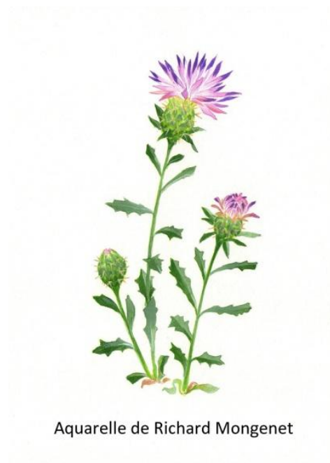
Aquarelle de Richard Mongenet